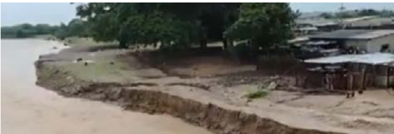
Vista frontal del río Grande en la parroquia Chanduy, donde se ahogó un niño de 11 años.

Ecuador, rodeado por los mayores productores de cocaína del mundo, Colombia y Perú, ha sido identificado como un punto clave para el tránsito de drogas hacia Europa y Norteamérica. En 2024, el país incautó 294,61 toneladas de droga, de las cuales la mayoría estaba destinada para el mercado internacional. Guayaquil ha sido uno de los principales escenarios de estas intervenciones exitosas.