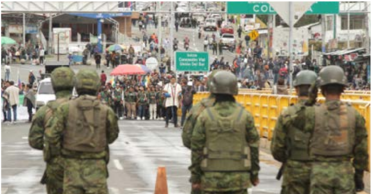
El puente internacional Rumichaca permanece cerrado por protestas indígenas colombianas.

Se espera que el 28 de febrero se realice una reunión entre las autoridades de Ecuador y Colombia para abordar la situación. Mientras tanto, los viajeros y camiones han intentado buscar alternativas para cruzar de un lado a otro. La situación sigue siendo monitoreada por las autoridades de ambos países.