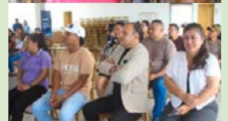
Estas capacitaciones tienen como finalidad impulsar el desarrollo turístico del cantón.