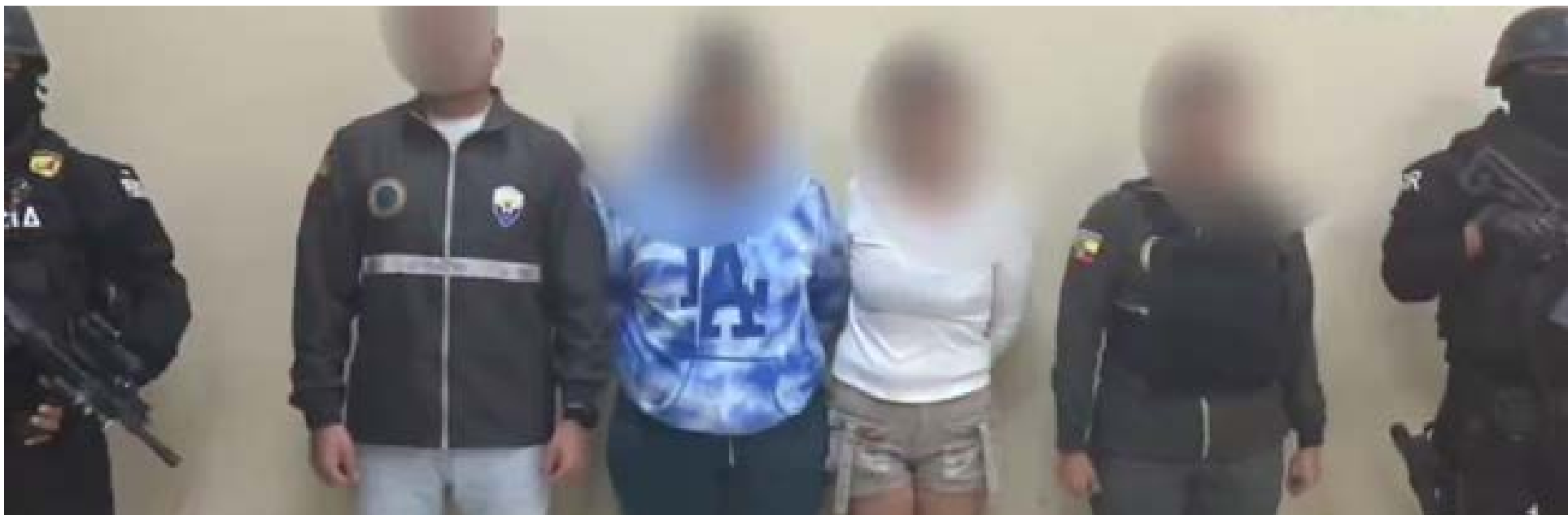
Las detenidas fueron aprehendidas en Saucos 2, Guayaquil, por estafar a migrantes con promesas de visas y pasaportes falsos.