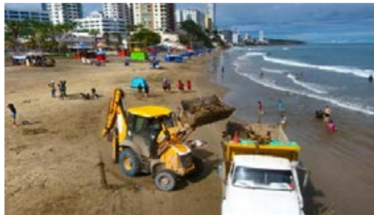
El municipio de Manta también está trabajando para mejorar las condiciones de las playas.

del restaurante Seaside Chill, indicó que ofrecen tres platos por 10 dólares y promociones con ceviches de pescado y mariscos, como langostinos y cangrejos. Estas promociones buscan satisfacer a los turistas que, además de disfrutar del mar, buscan opciones gastronómicas accesibles y deliciosas.