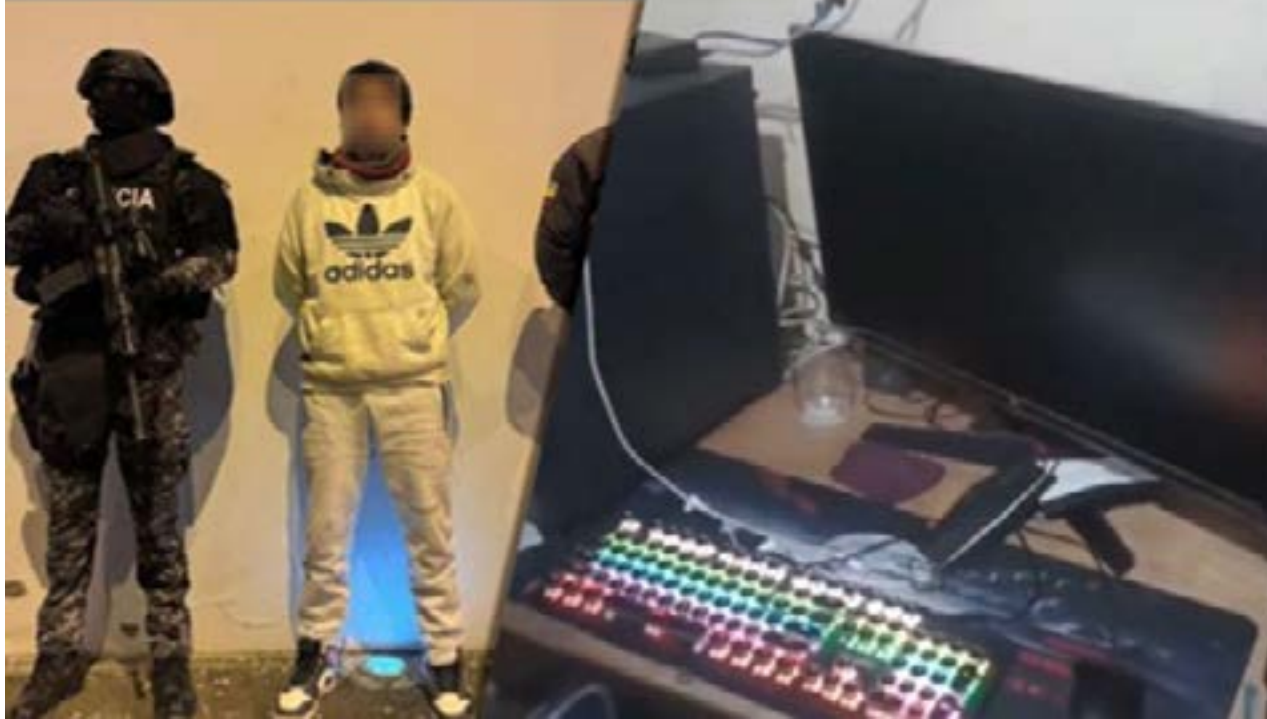
La Policía Nacional detuvo a un sospechoso de pornografía infantil en Ambato.