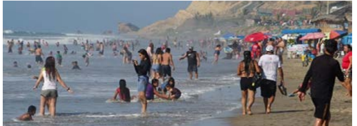
Los turistas ya disfrutan de las playas de Manta, mientras los comercios se preparan con ofertas especiales para el feriado de Carnaval.