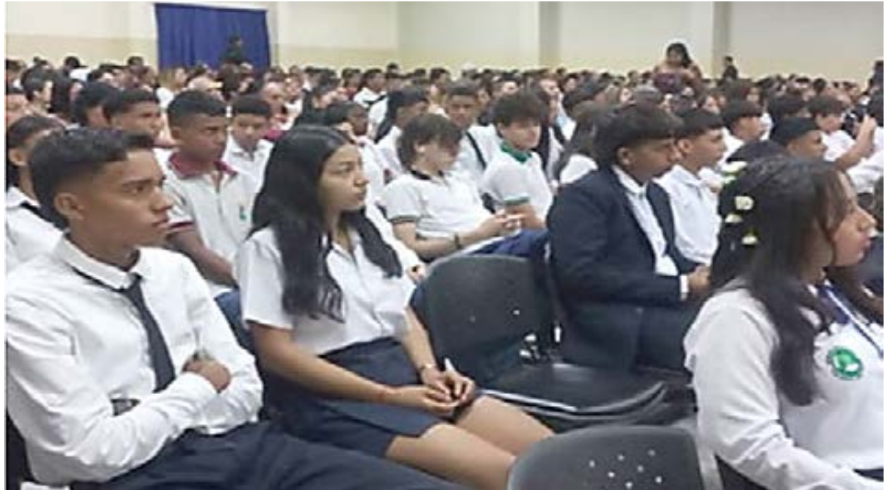
Estudiantes de Manta concluyen el programa de Nivelación y Aceleración Pedagógica (NAP).

El programa NAP cuenta con el apoyo de diez docentes, incluyendo tres que son vinculados directamente desde el ministerio de Educación.