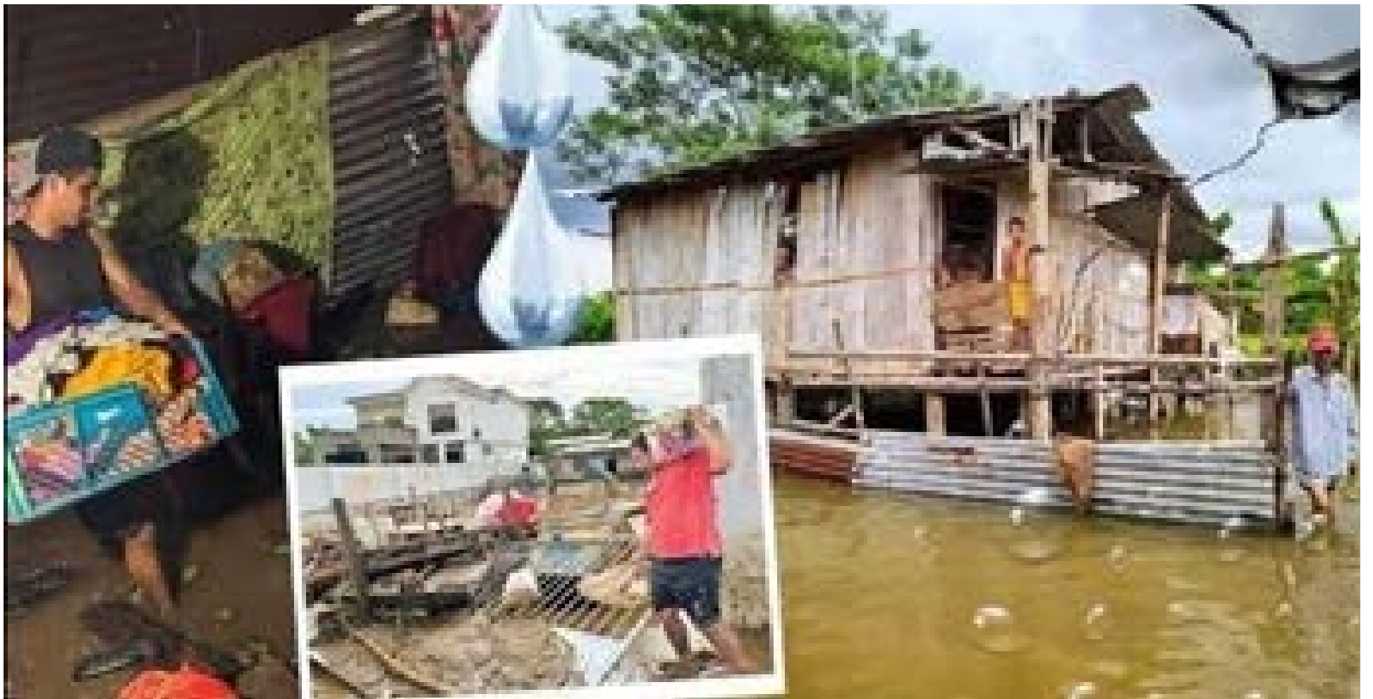
Los desastres ocasionados por la temporada invernal.