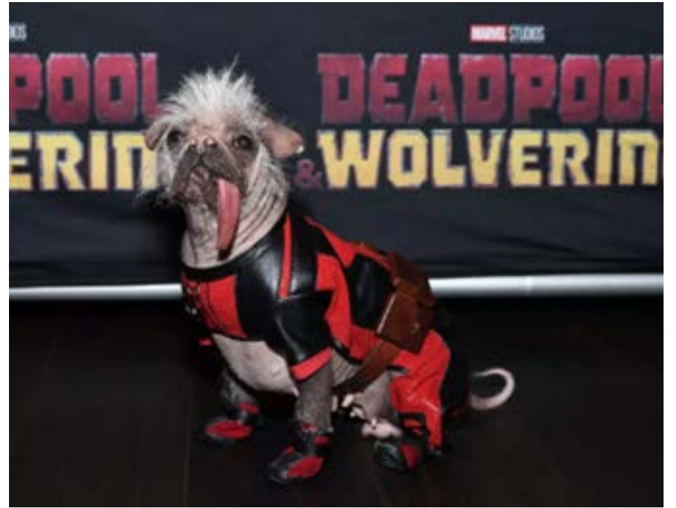
El perrito que se ha robado los corazones de millones en las redes por su apariencia tan singular.

En su diálogo con la audiencia, el comunicador reveló una de las razones que lo motivan a considerar esta opción. Contó que, al transitar por el puente que une la avenida Juan Tanca Marengo con la avenida José Antonio Gómez Gault, cerca del Colegio Americano, se sorprendió por el tiempo que tomó su construcción, casi cinco años. Este retraso le genera dudas sobre si se debe a problemas técnicos reales o a fallas en la gestión y burocracia.