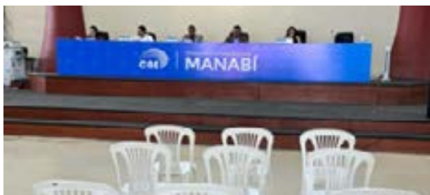
Evidencia de la ausencia de políticos ni asambleístas.

Con la segunda vuelta electoral acercándose, la atención del país se centra en el CNE y su capacidad para asegurar un proceso electoral sin impugnaciones ni irregularidades. Aunque la sesión de proclamación comenzó con ausencias, el CNE reafirma su compromiso de mantener la transparencia en las siguientes etapas del proceso electoral.