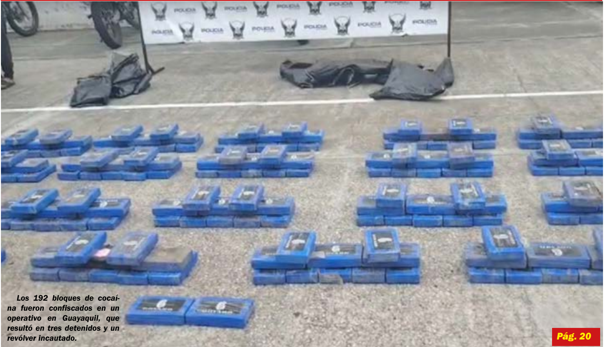
Los 192 bloques de cocaína fueron confiscados en un operativo en Guayaquil, que resultó en tres detenidos y un revólver incautado.