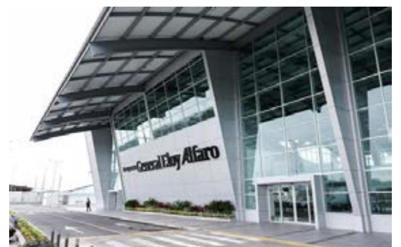
El Aeropuerto Eloy Alfaro de Manta ajustará su horario de operación, pasando de ser una terminal de 24 horas a operar de 06:00 a 22:00, según anunció la DGAC.

La DGAC reafirmó su compromiso de seguir evaluando la operatividad del aeropuerto y de tomar decisiones basadas en el uso real de las instalaciones, con el fin de garantizar una operación sostenible y eficiente. Aunque el cambio de horario podría generar