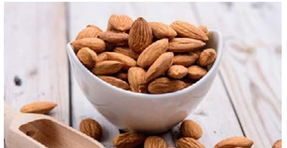
Un puñado de almendras, una fuente importante de vitamina E, un antioxidante esencial para la salud celular y cardiovascular.

Incorporar estos alimentos en la dieta diaria no solo mejora la salud a largo plazo, sino que también puede ser una forma deliciosa de prevenir enfermedades y envejecer de manera más saludable. Aunque los antioxidantes por sí solos no son una solución mágica, su inclusión en una dieta equilibrada, junto con un estilo de vida saludable, puede marcar una gran diferencia en la protección del cuerpo contra los efectos del tiempo y el estrés ambiental.