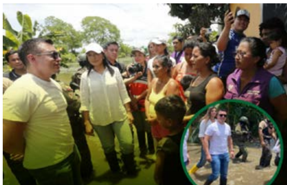
Daniel Noboa durante su visita por Calceta.