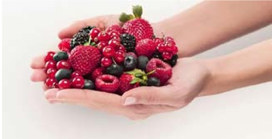
Una variedad de frutos rojos frescos, como arándanos y fresas, que son ricos en antioxidantes naturales.

TVD.- En un mundo cada vez más consciente de la importancia de la alimentación en la salud, los antioxidantes han tomado un lugar destacado en las conversaciones sobre bienestar. Estos compuestos naturales, presentes en muchos alimentos, tienen el poder de neutralizar los radicales libres en el cuerpo, lo que contribuye a prevenir el daño celular y el envejecimiento prematuro. Además, diversos estudios sugieren que los antioxidantes pueden jugar un papel crucial en la prevención de enfermedades crónicas como el cáncer, enfermedades cardíacas