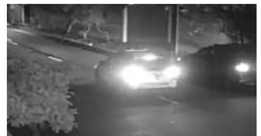
Vehículo Toyota Fortuner involucrado en el enfrentamiento armado en Quito.

Como resultado del enfrentamiento, un hombre falleció, tres personas fueron detenidas y se incautaron cuatro armas de fuego. El conductor del vehículo logró escapar, posiblemente con heridas. La Policía Nacional del Ecuador sigue investigando el incidente y busca al conductor fugado.