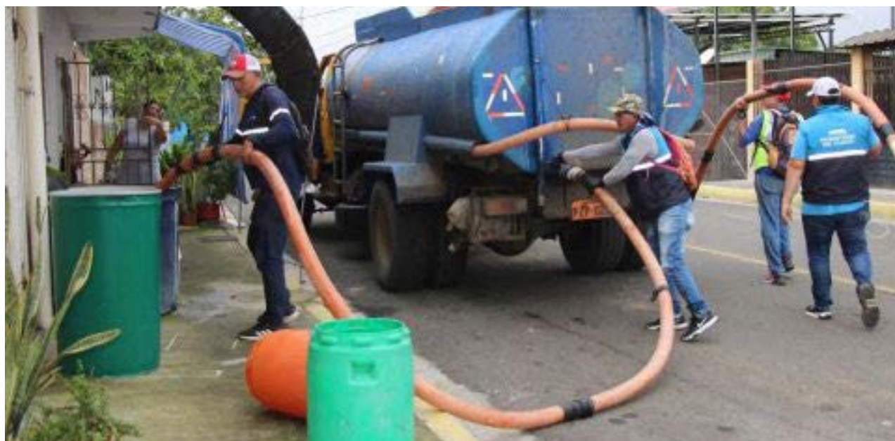
Un tanquero abastece de agua a una familia en Manta, donde la falta de agua potable es un problema crónico.

Es importante que las autoridades locales y nacionales trabajen juntas para encontrar una solución a este problema que afecta a miles de habitantes de Manabí. La falta de agua potable es un derecho fundamental que debe ser garantizado para todos los ciudadanos.