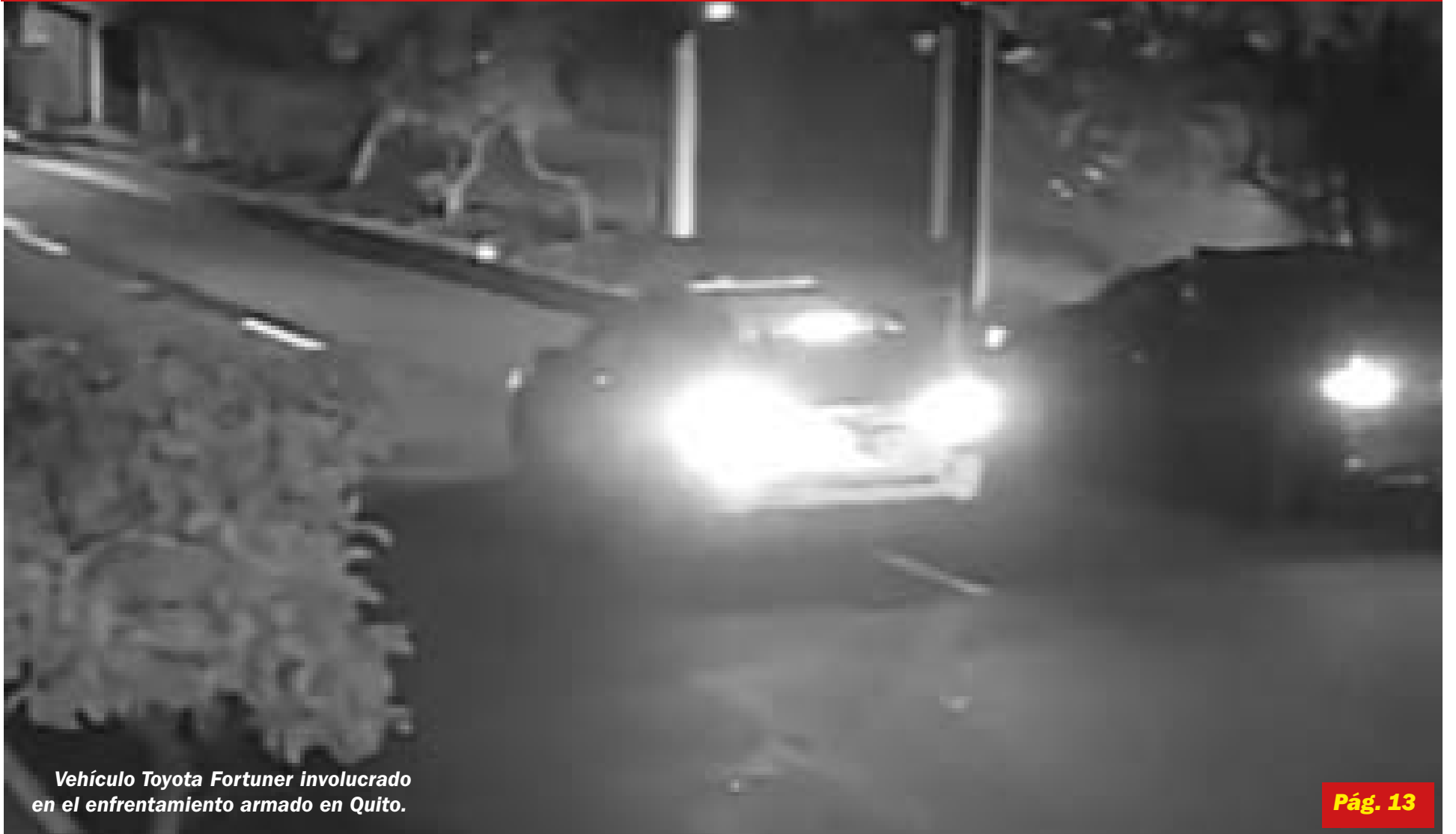
Vehículo Toyota Fortuner involucrado en el enfrentamiento armado en Quito.