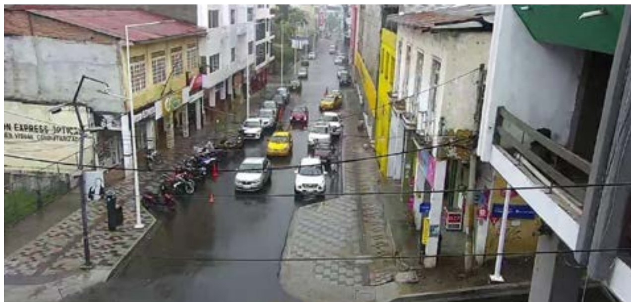
Trabajadores de mantenimiento limpian el alcantarillado para prevenir inundaciones en la ciudad.

La ciudad seguirá trabajando para garantizar la seguridad y el bienestar de todos sus residentes. Se agradece la colaboración y la vigilancia de la ciudadanía en este esfuerzo.