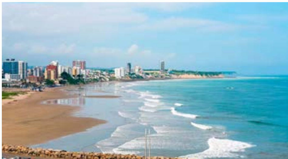
Vista panorámica de Playa El Murciélago en Manta, uno de los principales destinos turísticos de Ecuador.

les y modernas. Un ejemplo de ello es la Fiesta de San Pedro y San Pablo, celebrada cada año en junio. Esta fiesta es una de las más importantes, en la que los pescadores locales realizan procesiones y misas, además de llevar sus embarcaciones al mar para recibir la bendición y protección para sus faenas. Además de sus costumbres tradicionales, Manta ofrece una vibrante vida nocturna con bares y discotecas como One Cocktail Lounge & Grill, Molotov Rock Bar, y Dēja Vú B&K, convirtiéndose en un destino para quienes buscan disfrutar de una noche de diversión.