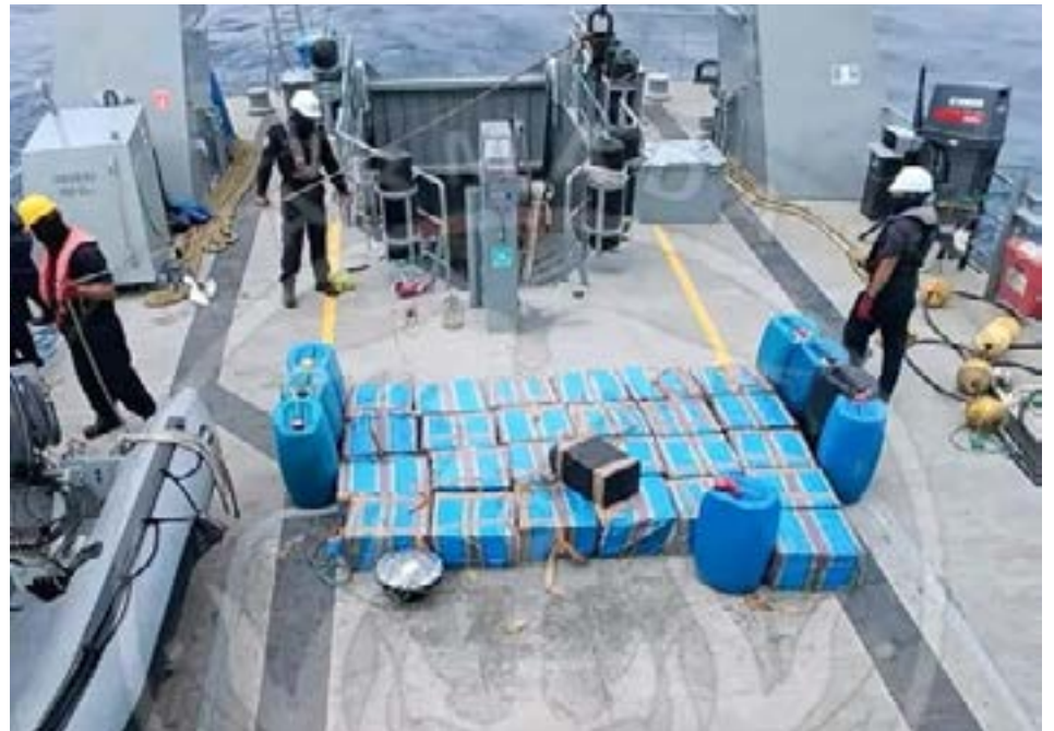
La Armada del Ecuador incauta una embarcación con droga en Galápagos.

Las personas detenidas, dos de nacionalidad colombiana y una de nacionalidad ecuatoriana, transportaban 37 bidones de presunto combustible y 28 sacos de yute con presuntas sustancias catalogadas sujetas a fiscalización. La droga iba en 43 bultos, según datos de la Armada.