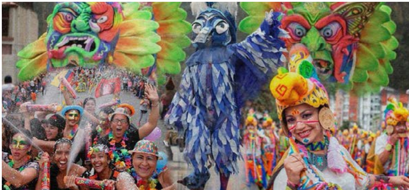
Desfile de comparsas en Guaranda, una de las celebraciones más tradicionales del Carnaval en Ecuador.

Desde la Sierra hasta la Costa, Ecuador muestra su riqueza cultural con una variedad de festividades, lo que lo posiciona como una opción destacada para vivir el Carnaval en Sudamérica.