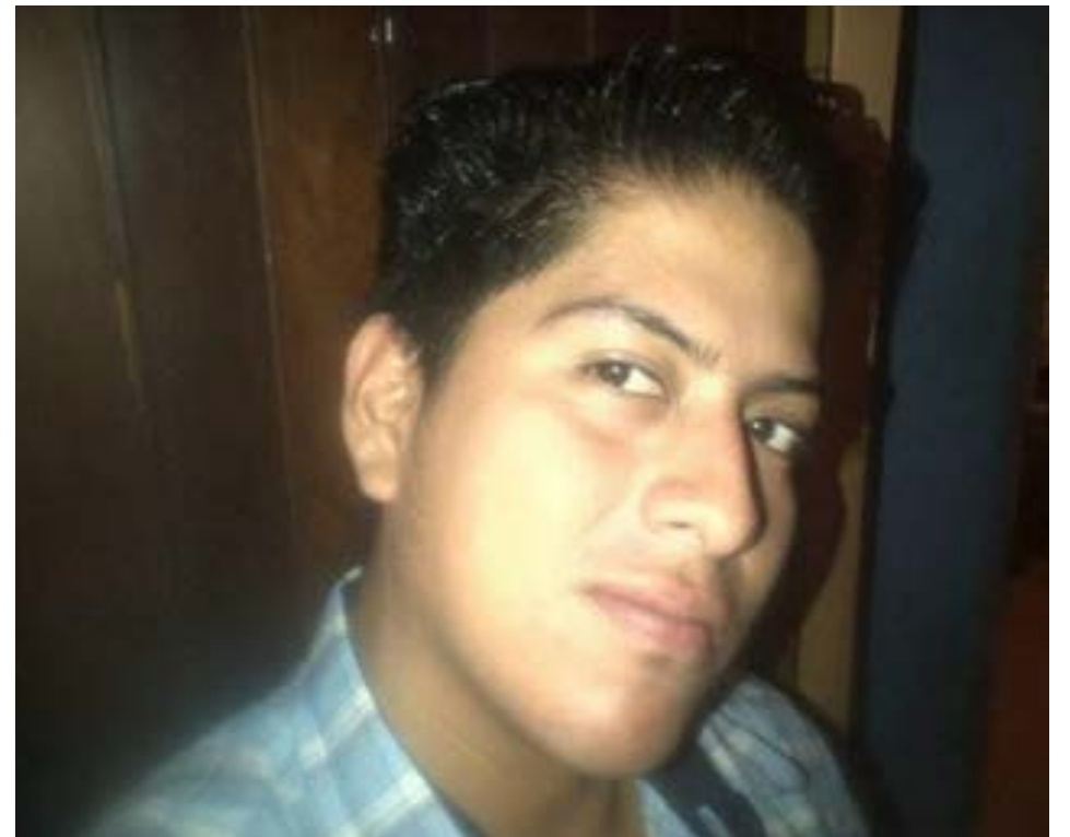
El venezolano de 33 años que perdió la vida en un trágico accidente de motocicleta en la vía Circunvalación de Manta.

La comunidad de Manta se une en el dolor por la pérdida de esta joven vida, y se espera que las autoridades puedan esclarecer las circunstancias del accidente.