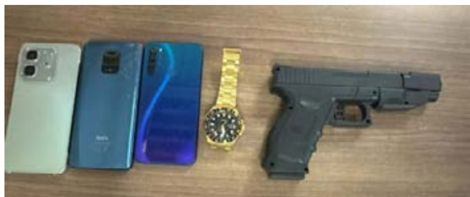
Los objetos incautados en la operación "Tsunami".

TVD.- La Policía Judicial de Manta desarticuló una presunta banda de robo de motocicletas, compuesta por cuatro jóvenes, que operaba en la ciudad y estaba afín al grupo de Los GDO. La red fue desmantelada tras una serie de allanamientos y detenciones, en los que se incautaron tres vehículos robados, tres cascos, tres celulares y un arma de juguete.