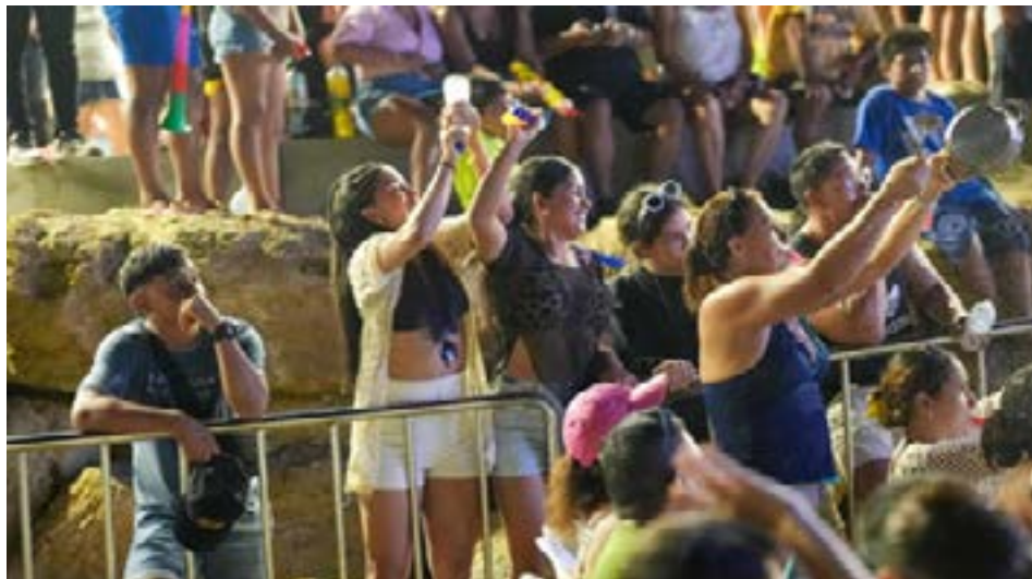
La velada estuvo llena de música y danza, y los asistentes disfrutaron de una atmósfera festiva.