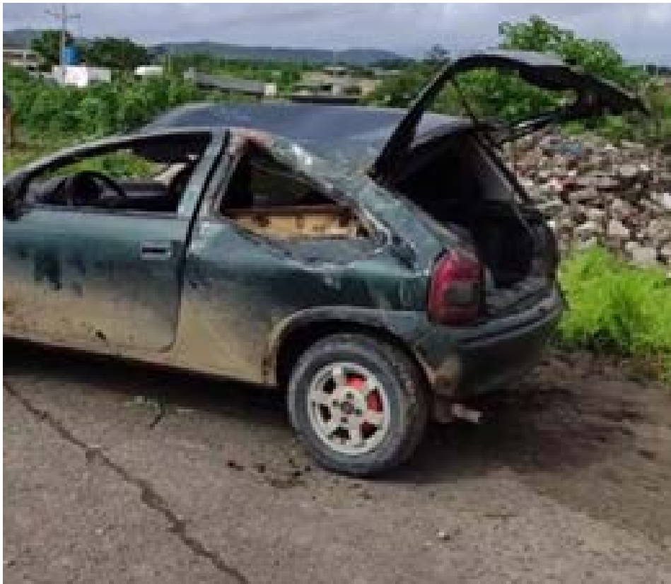
Un vehículo siniestrado en la Ruta Sponylus, donde cuatro vehículos colisionaron.