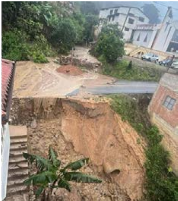
Un vehículo arrastrado por la corriente del aluvión en Piñas.