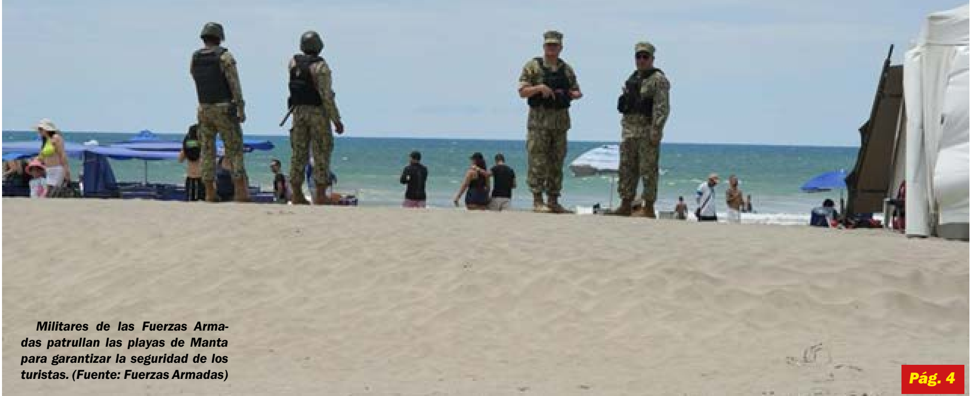
Militares de las Fuerzas Armadas patrullan las playas de Manta para garantizar la seguridad de los turistas.