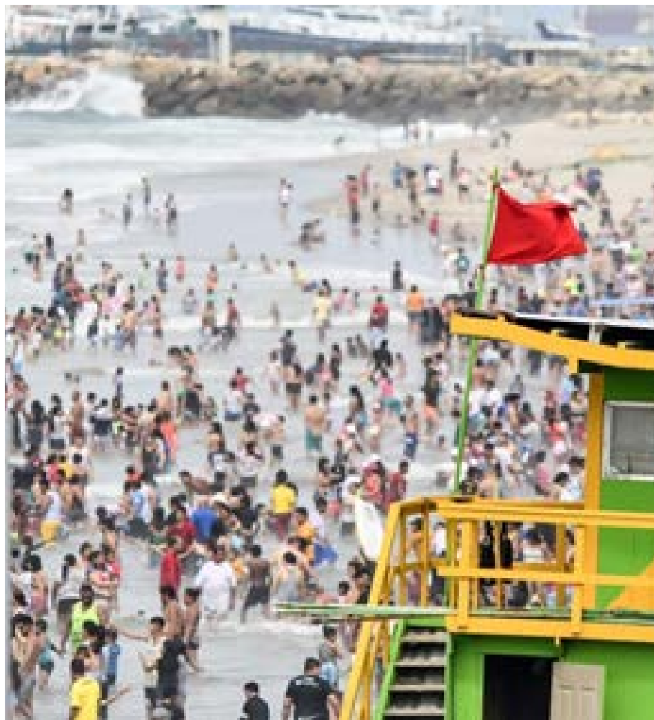
Turistas disfrutaban de la playa en Manta, a pesar de la lluvia.

En resumen, el clima en Manta durante el Carnaval 2025 será cálido y húmedo, con lluvias frecuentes. Sin embargo, con un poco de planificación y preparación, los turistas pueden disfrutar de una experiencia inolvidable en esta ciudad costera.