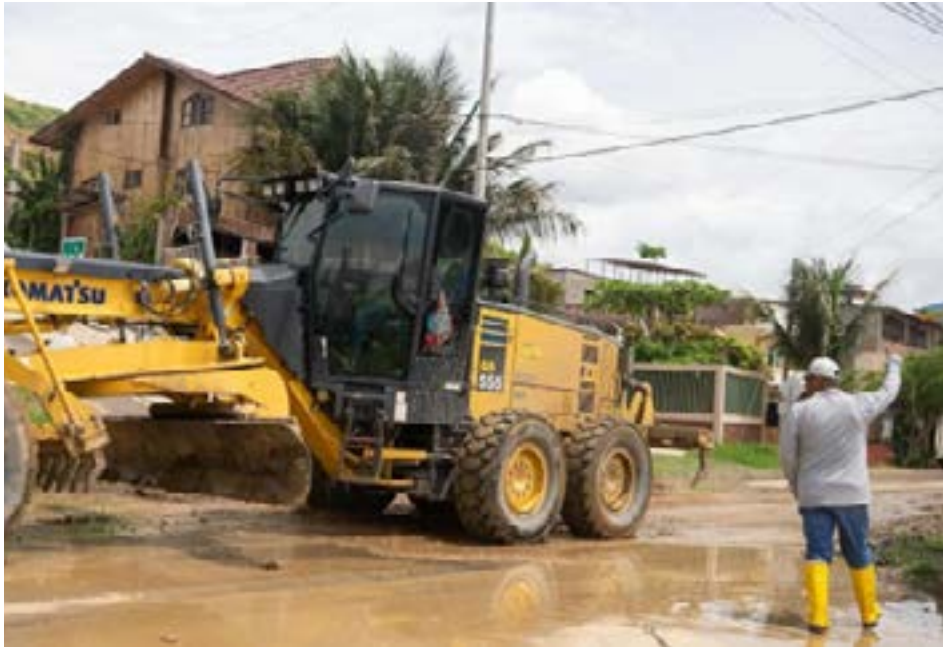
La intervención inmediata en Santa Maríanita permitió restaurar la normalidad en la parroquia y permitir el acceso a los turistas.