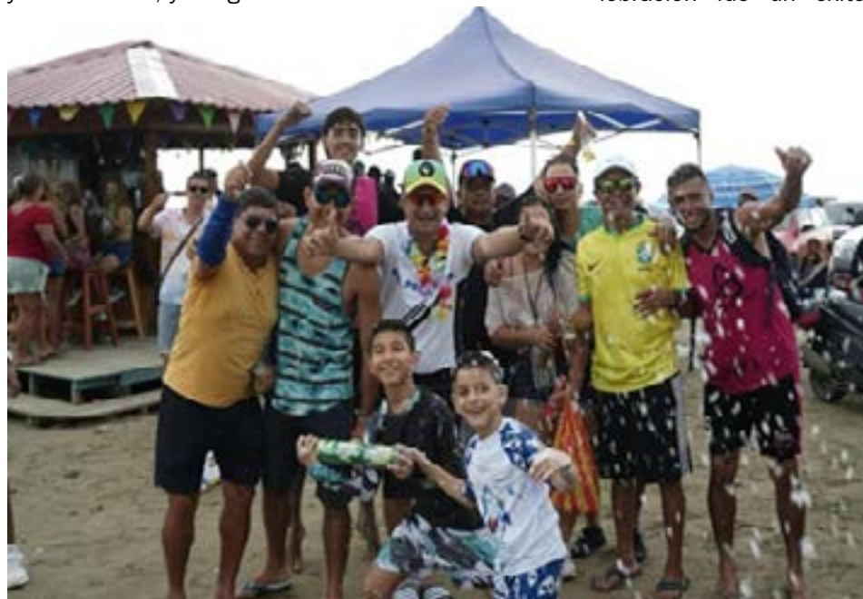
Miles de personas se reunieron en Manta para disfrutar del carnaval.