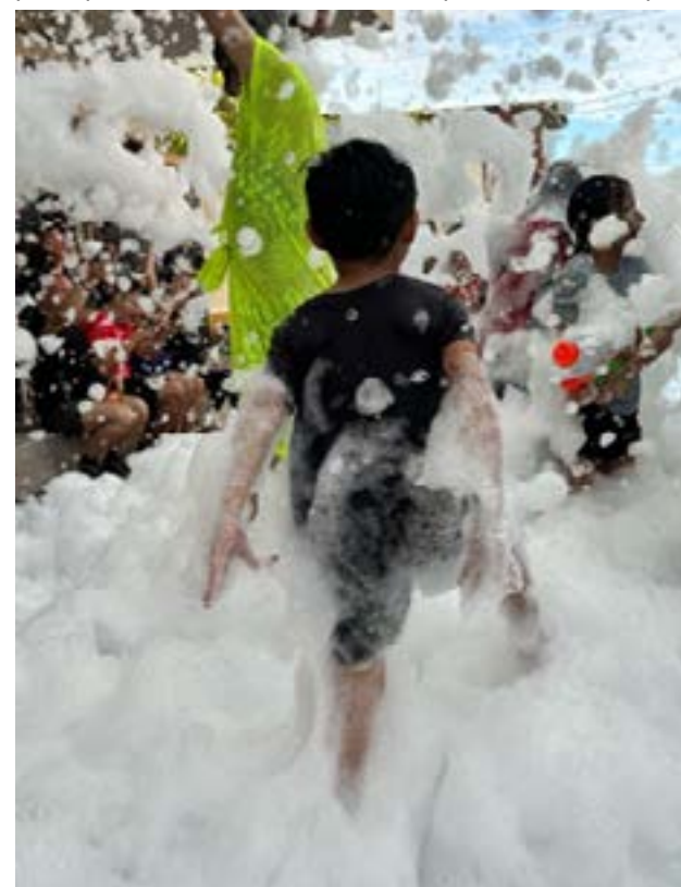
Niños celebran el carnaval con espuma en el barrio Perpetuo Socorro.

fueron los ingredientes principales de una celebración que será recordada por mucho tiempo.