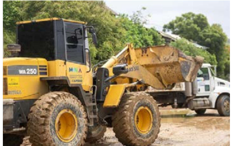
La maquinaria de la Alcaldía de Manta trabajó arduamente para despejar toneladas de material desplazado en la vía que conecta Santa Maríanita con Pacoche.