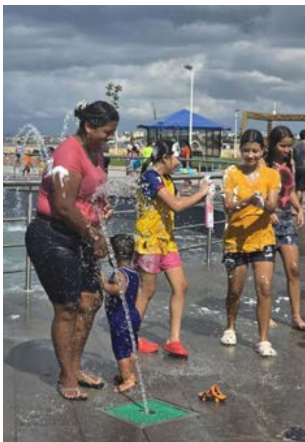
Familiares en el Megaparque, en el último día de Carnaval.

La diversión y la alegría han sido las características principales del Carnaval en Manta, y la espuma y el agua han sido los elementos que han hecho posible la celebración. Los mantenses y turistas se han unido para disfrutar de la fiesta, y han creado un ambiente de diversión y alegría que será recordado por mucho tiempo.