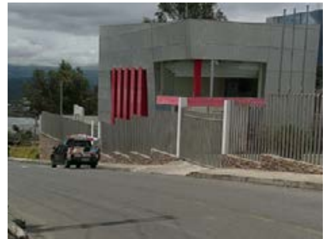
Hasta el Centro Forense fueron trasladados los cuerpos de ambas mujeres a la espera que los familiares los reconozcan y retiren.