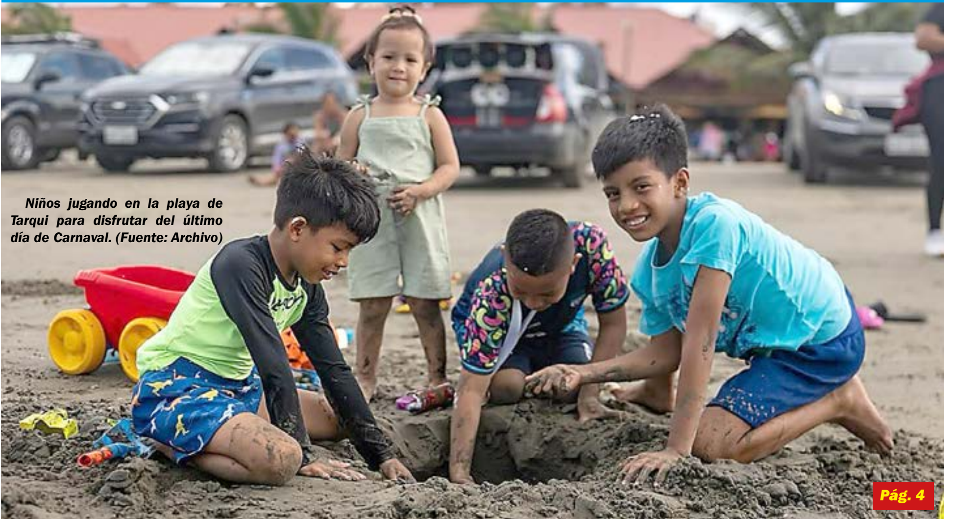
Niños jugando en la playa de Tarqui para disfrutar del último día de Carnaval.