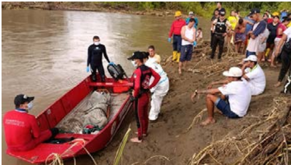
Los bomberos de Portoviejo encontraron el cadáver del joven en el río Chico.

La búsqueda culminó este martes 4 de marzo, cuando los bomberos encontraron el cadáver del joven. Las autoridades están investigando las circunstancias que rodearon la tragedia.