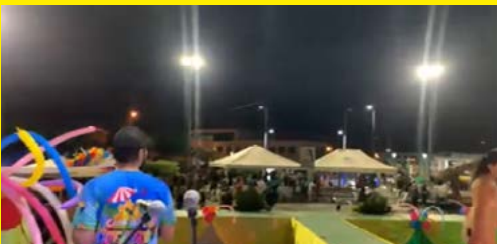
La Policía y las autoridades están investigando el enfrentamiento armado en Puerto El Carmen.

La seguridad en la zona ha sido reforzada después del incidente, y las autoridades están trabajando para garantizar la seguridad de los ciudadanos y visitantes en la región. El evento de carnaval se suspendió temporalmente después del enfrentamiento, pero se reanudó posteriormente con medidas de seguridad adicionales.