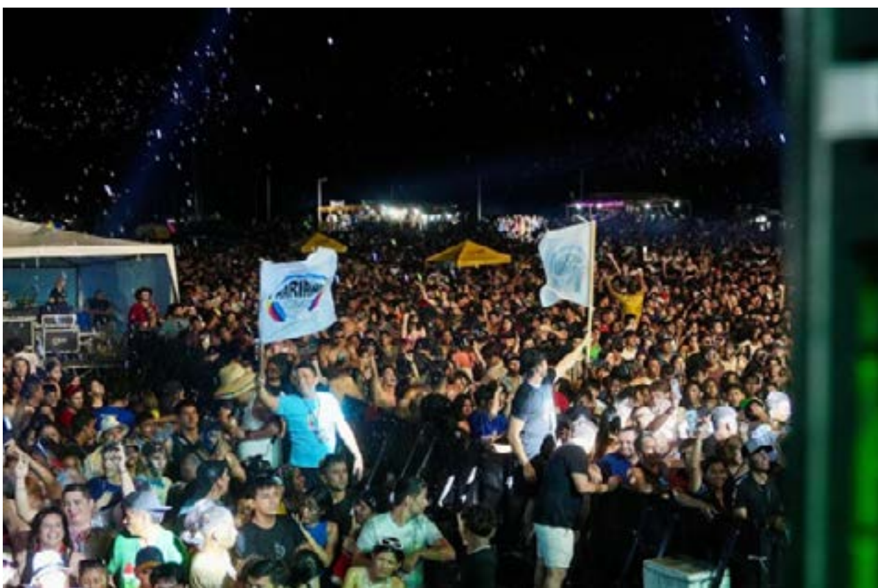
Los ecuatorianos disfrutaron de la música y el ambiente en la Playa del Murciélagu.

La celebración del carnaval en Manta también contó con la presencia de turistas de todo el país y del extranjero. La ciudad portuaria se convirtió en el destino favorito de muchos durante el fin de semana del carnaval, y los hoteles y restaurantes de la zona se llenaron de personas que buscaban disfrutar de la fiesta.