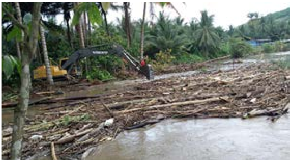
Como cada año, la temporada invernal obstruye los caudales de la provincia

Estas acciones son fundamentales para mitigar los efectos de la temporada invernal y prevenir mayores afectaciones en el cantón. Continuamos en alerta y comprometidos con la seguridad de todos.