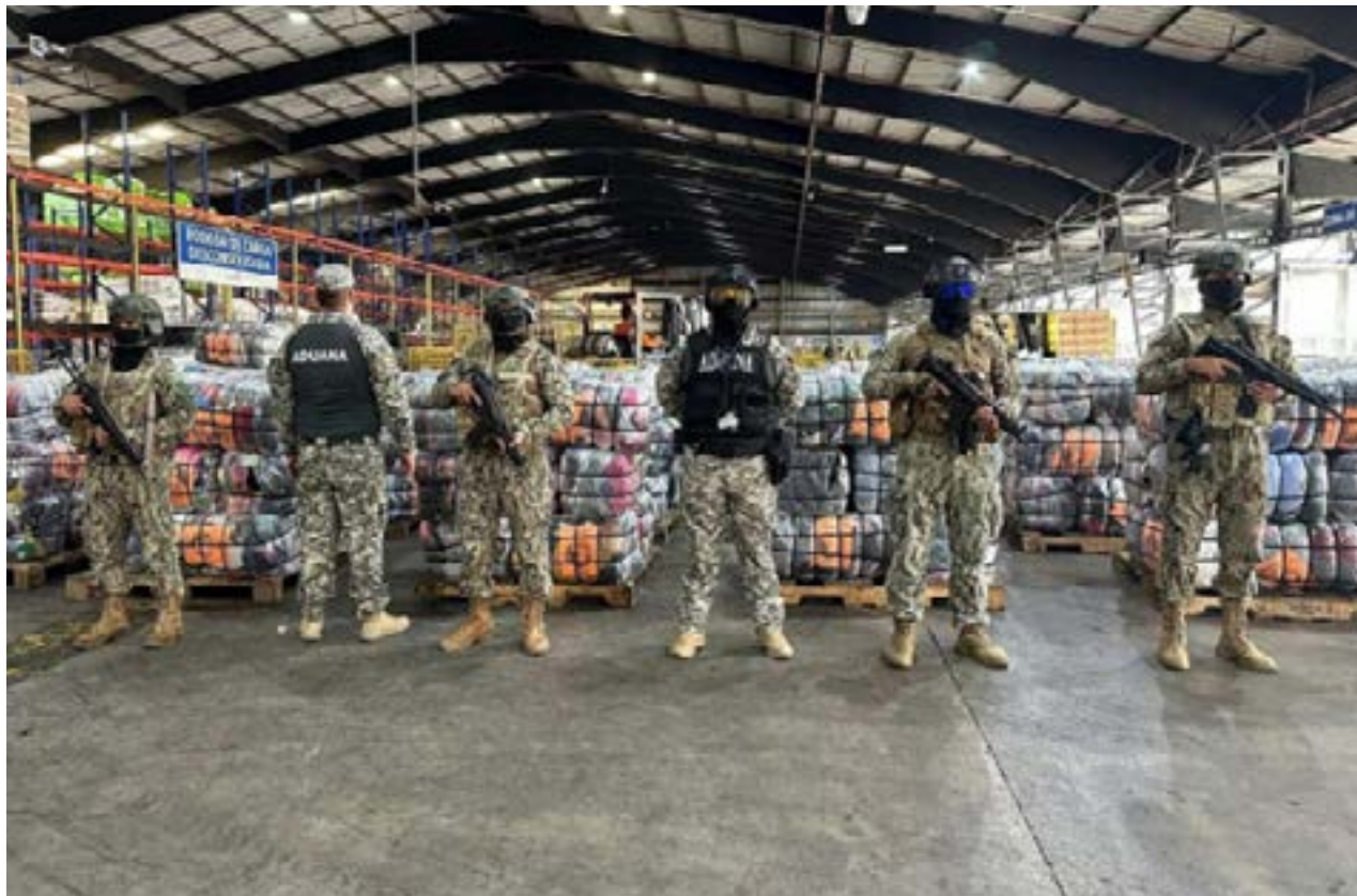
El cargamento de ropa de contrabando incautado en el puerto de Guayaquil.

Tras la incautación, la evidencia fue puesta a órdenes de la autoridad competente para su respectiva judicialización. Las autoridades seguirán ejecutando patrullajes en los puertos y fronteras del país para prevenir futuras actividades de contrabando.