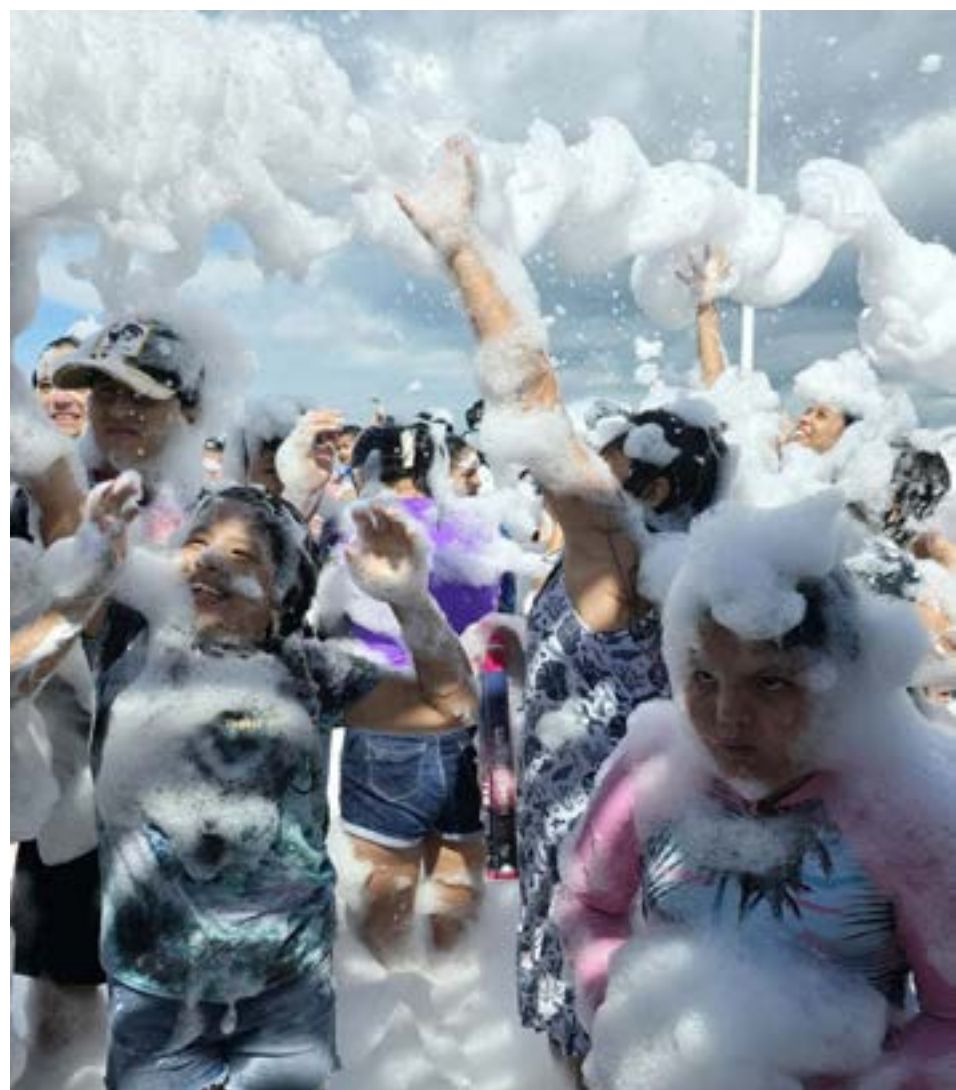
Niños y adultos se divirtieron con la espuma y el agua en el Megaparque, en el último día de Carnaval.