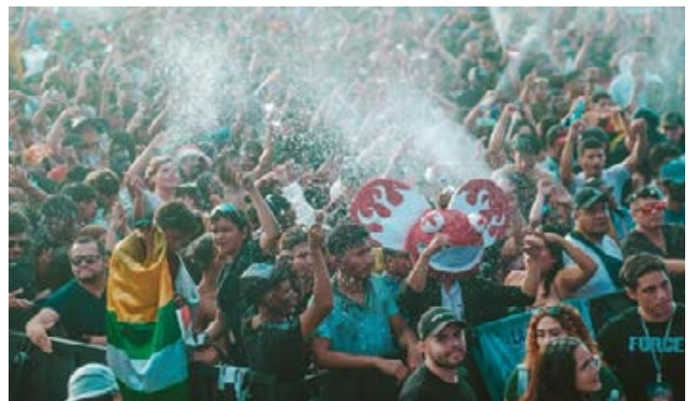
La playa de El Murciélago se convirtió en el punto de encuentro de quienes buscaban sentir la diversión del Carnaval.