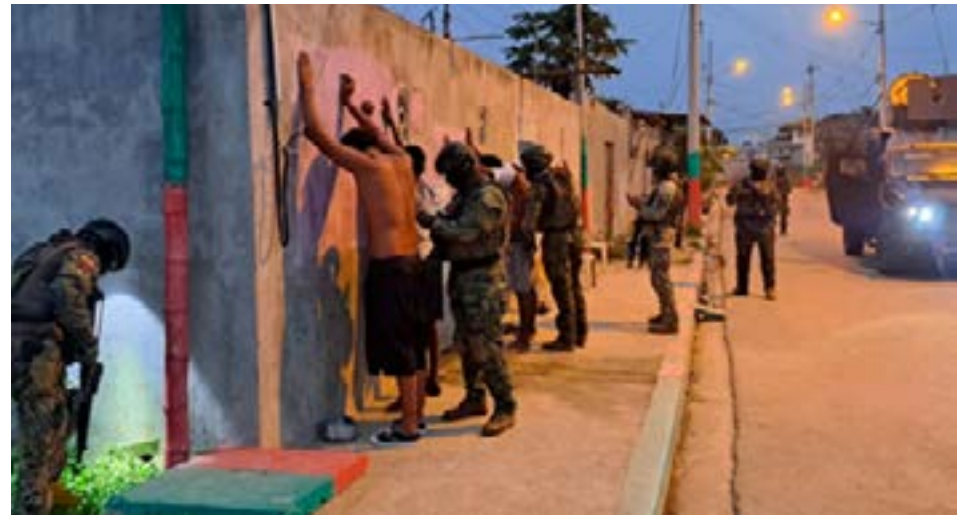
El presidente Daniel Noboa anunció la extensión del estado de excepción en varias provincias y cantones del país. (Fuente: Archivo)

La Policía Nacional y la Fiscalía investigan el hallazgo de un cuerpo decapitado en Yaguachi, Guayas. (Fuente: Archivo)