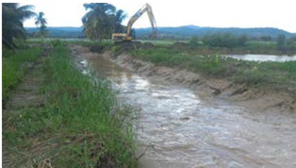
Maquinaria interviniendo en la limpieza de los ríos.