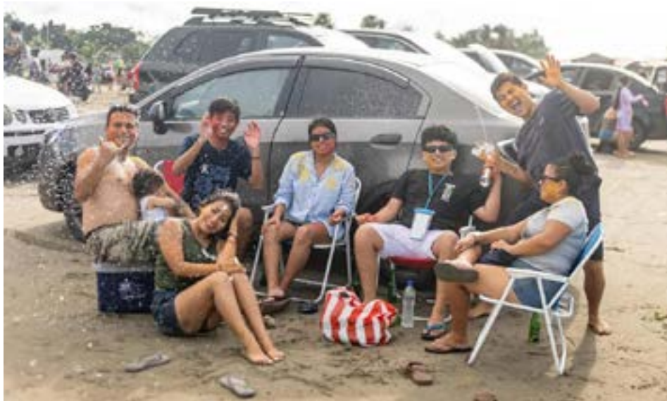
Familias se reunieron en la playa de Tarqui para disfrutar del último día de Carnaval.

TVD.- La playa de Tarqui sigue siendo una de las favoritas de los mantenses y turistas que visitan la ciudad de Manta. Este martes 4 de marzo, último día de Carnaval, la playa se llenó de miles de personas que buscaron disfrutar del sol, la arena y el mar.