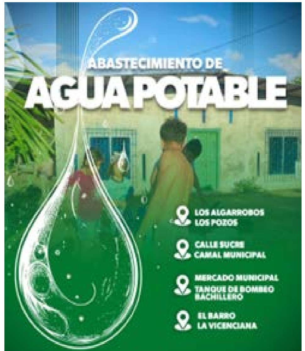
Gad de Tosagua