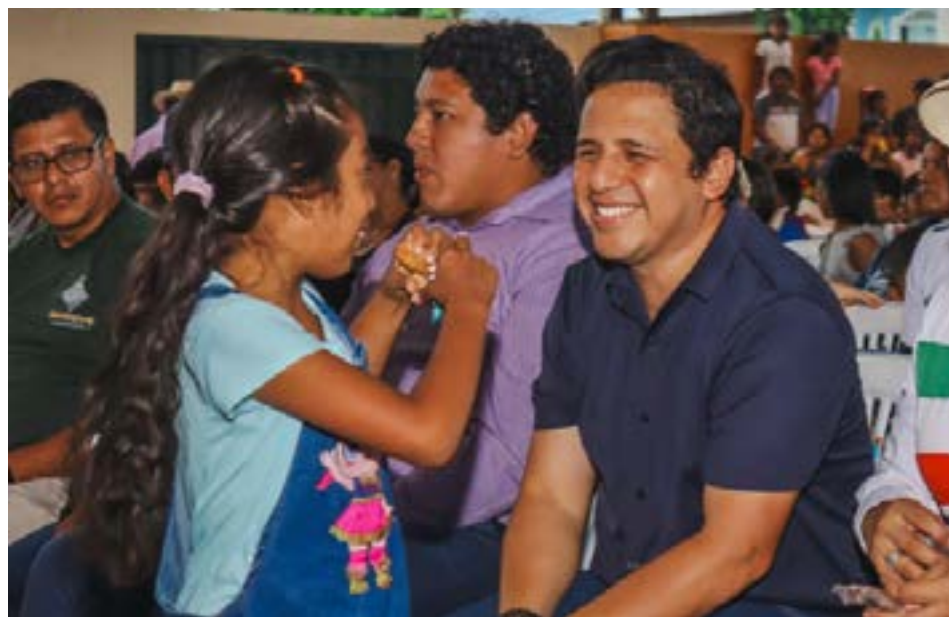
Jonathan Toro, Alcalde de Cantón Montecristi, dando inicio a los Cursos Vacacionales 2025, una iniciativa que promueve el desarrollo cultural, deportivo y emprendedor de los ciudadanos del cantón.

El éxito de estos programas es el reflejo del esfuerzo y la dedicación de la comunidad, que se ha volcado en esta oportunidad para mejorar su calidad de vida. Las autoridades locales continúan trabajando para ofrecer más opciones y expandir estos talleres en el futuro, con el objetivo de seguir fomentando el talento y el emprendimiento de los ciudadanos. La participación de todos es clave para seguir haciendo crecer estos proyectos.