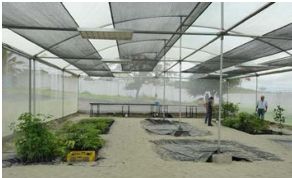
La lengua de suegra, una de las especies que se reproducirán en el Centro de Desarrollo Forestal de Manta, es una planta autogenerativa que absorbe dióxido de carbono y resiste bien a las temporadas secas.

El Centro de Desarrollo Forestal de Manta es un paso importante hacia la sostenibilidad y la protección del medio ambiente en la región. Su trabajo contribuirá a la reforestación, la reducción de la contaminación y la promoción de la biodiversidad.