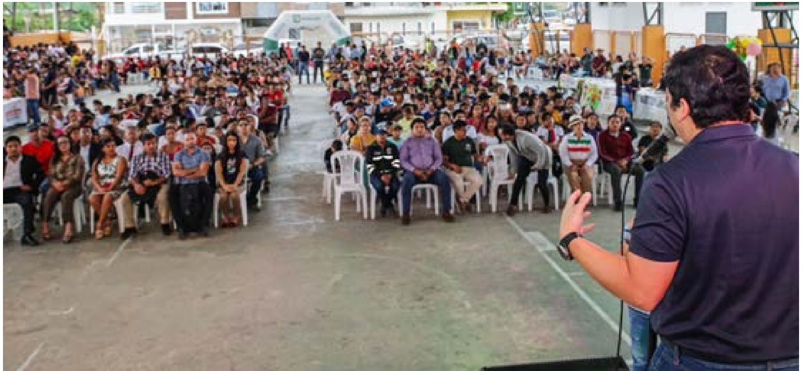
Niños y jóvenes participan en un taller como parte de los Cursos Vacacionales 2025, fomentando la creatividad y el arte en la comunidad.

Los cursos están orientados a diversas categorías, como las artes, el deporte y las actividades sociales, y tienen como objetivo fundamental potenciar el talento local. Desde el miércoles 5 de marzo y hasta el viernes 2 de mayo, la comunidad tendrá acceso a una oferta educativa que beneficia a más de 1,370 personas en diversas actividades culturales, artísticas y deportivas. La adminis-