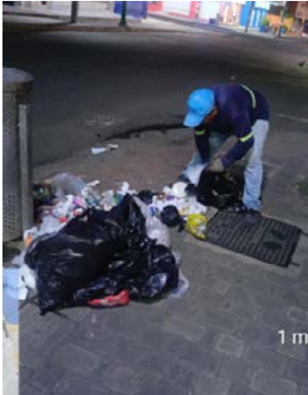
La maquinaria pesada ayudó a retirar la basura en la Flavio Reyes.

TVD. - Durante el reciente feriado de Carnaval, entre el viernes 28 de febrero y el martes 4 de marzo, la Dirección de Higiene del Municipio de Manta llevó a cabo un arduo trabajo de limpieza en las playas de la ciudad. En total, se retiraron 410 toneladas de palizada y 125 toneladas de basura común dejada tanto por los turistas como por el consumo de los locales. Este esfuerzo fue parte de un operativo especial para garantizar que las playas amanecieran limpias cada día del feriado.