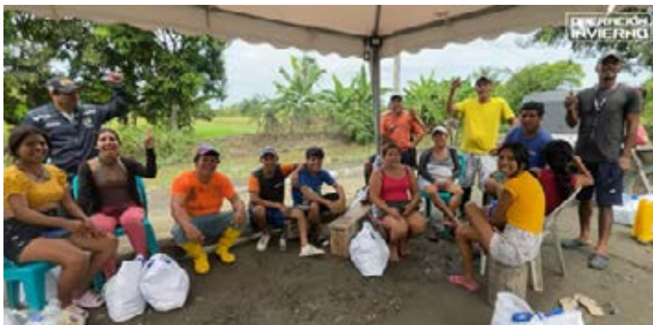
Algunos de los moradores que recibieron las ayudas de los kits.

forma parte de un esfuerzo conjunto entre autoridades locales y organizaciones comunitarias, con el fin de mitigar el impacto de las lluvias y brindar alivio a quienes más lo necesitan. Los kits alimenticios incluyen productos básicos como arroz, harina, aceite y otros elementos esenciales para las familias afectadas, quienes han expresado su agradecimiento por este valioso apoyo.