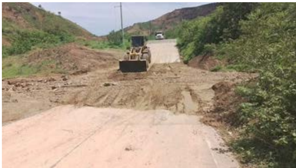
Trabajos de limpieza en la vía Santa Marianita-Pacocha. Nuestro equipo ha estado trabajando incansablemente para garantizar la seguridad y accesibilidad de la vía.