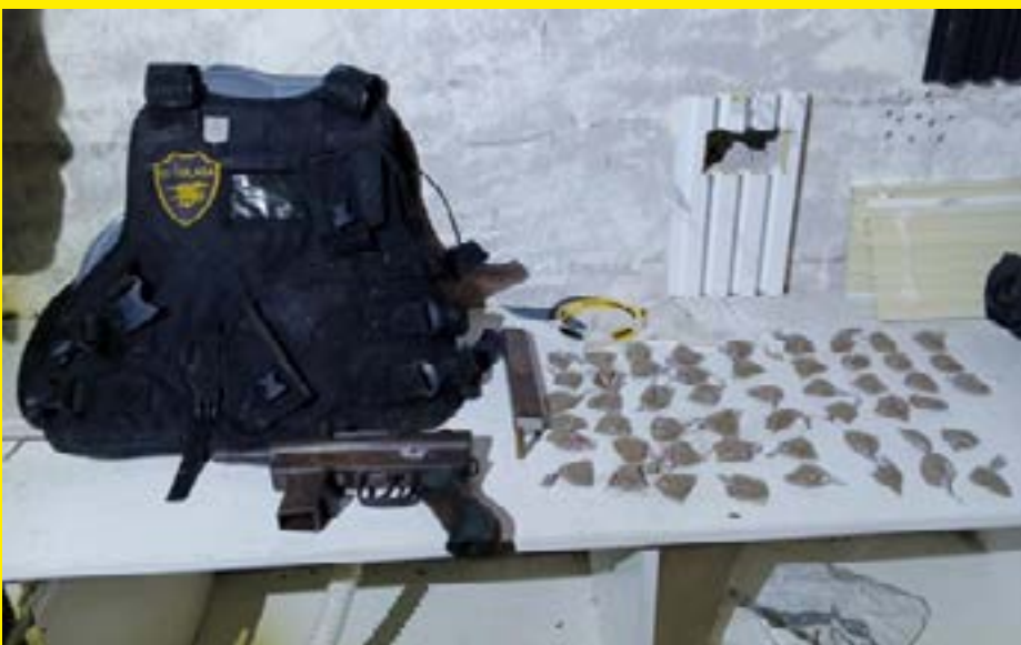
Miembros del Ejército Ecuatoriano presentan los objetos decomisados durante la operación en la parroquia de Puerto Bolívar, incluyendo armas, explosivos y drogas.

TVD. - El Ejército Ecuatoriano llevó a cabo una importante operación en la parroquia de Puerto Bolívar, ubicada en el cantón Machala, en la provincia de El Oro. La intervención, que tuvo lugar en el barrio Venecia del Mar, resultó en varios allanamientos donde se incautaron diversos materiales ilícitos. Entre los objetos decomisados se encontraron una subametralladora artesanal, una alimentadora para 30 cartuchos, una carga explosiva armada, un chaleco antibalas, dos motores fuera de borda, una moto robada y sobres con marihuana.