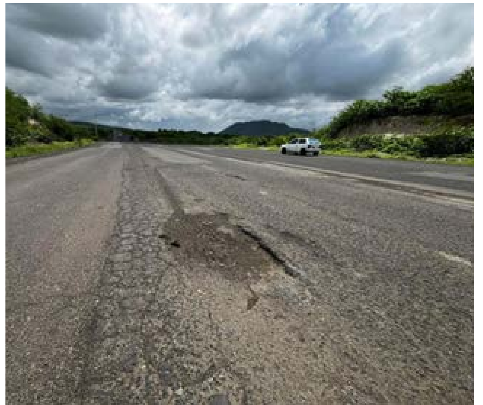
El deterioro de la vía Colisa sigue afectando el tránsito entre Montecristi y Jaramijó, causando preocupación entre los conductores y habitantes de la zona.

El esfuerzo conjunto de las autoridades y el personal de la Dirección de Higiene refleja el compromiso de la ciudad de Manta por mantener sus playas limpias y seguras, especialmente durante las temporadas de alto flujo turístico. Las autoridades han agradecido el apoyo de la ciudadanía y han instado a todos los visitantes a colaborar en la conservación del entorno, evitando la contaminación de las playas y contribuyendo al cuidado del medio ambiente.