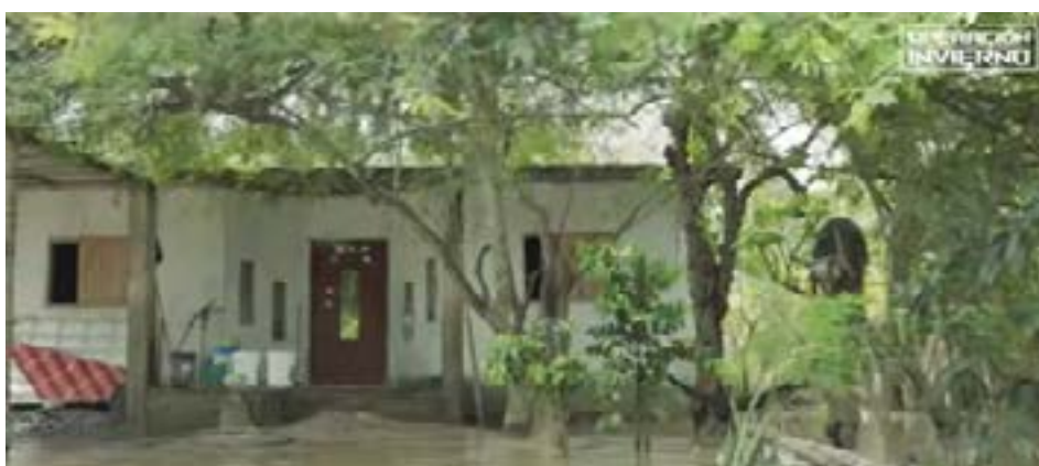
Los estragos del inviernos en Crucita.