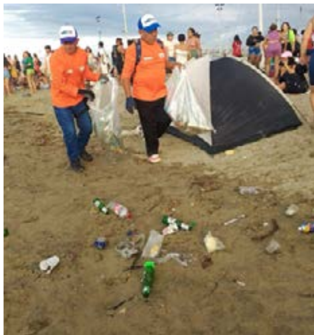
Operativo de limpieza en las playas de Manta durante el feriado de Carnaval, con personal municipal recolectando palizada y basura.

incluyeron la recolección de grandes cantidades de palizada que continuaba llegando a las playas por la fuerza de las lluvias en las zonas rurales. Esto añadió un desafío adicional para el equipo, que trabajó sin descanso para minimizar el impacto ambiental y garantizar la seguridad de los bañistas. La limpieza de las playas no solo se enfocó en la estética, sino también en prevenir cualquier posible daño ambiental debido a los residuos arrastrados por las lluvias.