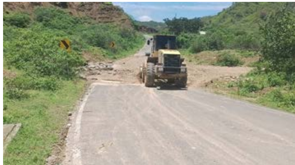
Equipo de trabajo limpiando badenes en la vía Santa Marianita-Pacocha. Hasta el momento, hemos limpiado 14 badenes y atendido varios puntos de las vías principales.