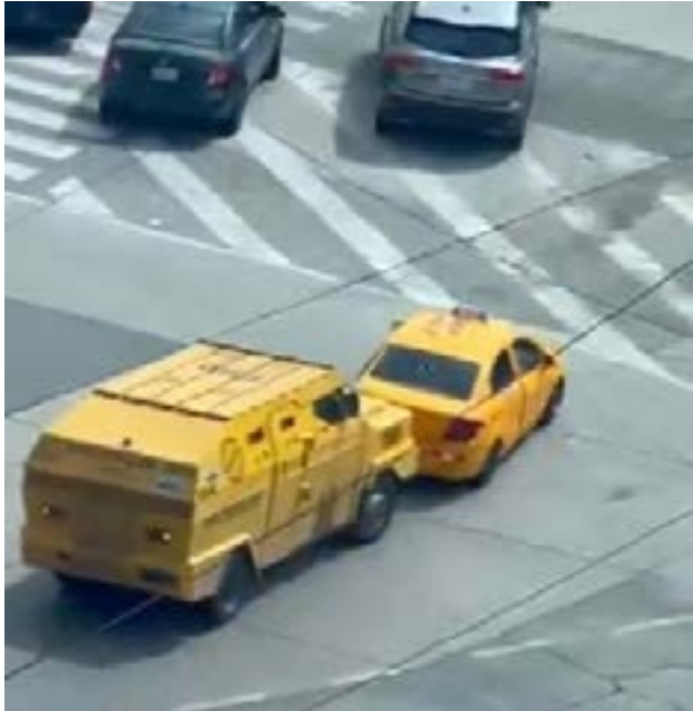
Momento del intento de asalto al blindado en Guayaquil, cuando un taxi interceptó el camión de valores y comenzó la balacera.

TVD. - Un intento de asalto a un camión blindado de transporte de valores tuvo lugar la mañana de este 6 de marzo en el norte de Guayaquil, cerca del centro comercial Mall del Sol. Al menos seis sujetos armados intentaron robar el blindado, en un ataque que recordó a las escenas de las