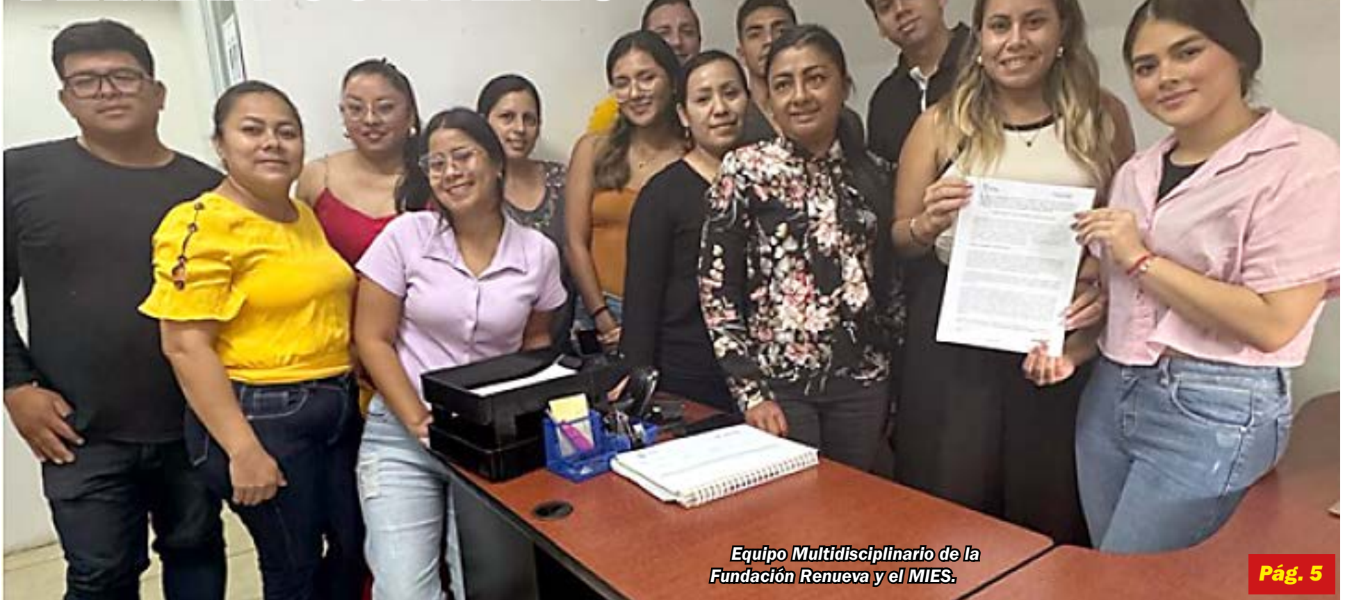
Equipo Multidisciplinario de la Fundación Renueva y el MIES.