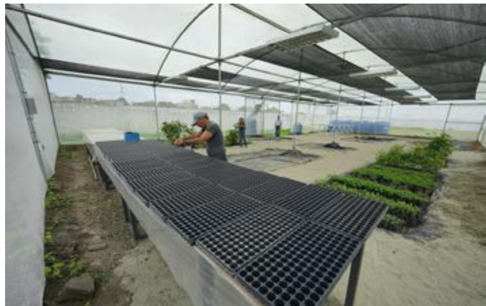
El Centro de Desarrollo Forestal de Manta está equipado con modernas instalaciones para la reproducción de especies ornamentales y forestales.