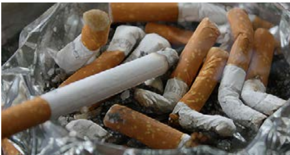
Los beneficios de dejar de fumar y reducir el alcohol son inmediatos y duran a lo largo del tiempo.

cológico. Los programas de tratamiento como la terapia cognitivo-conductual pueden ayudar a las personas a identificar y cambiar patrones de comportamiento relacionados con el consumo de alcohol. Además, la participación en grupos de apoyo como Alcohólicos Anónimos ha demostrado ser útil para muchas personas que luchan por reducir o eliminar el consumo de alcohol. Los cambios en el entorno social, como evitar situaciones donde se beba en exceso, también son fundamentales para el éxito en el proceso.