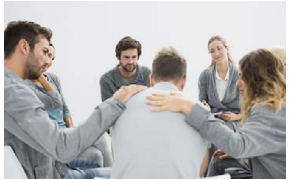
La terapia cognitivo-conductual y los grupos de apoyo son fundamentales para reducir el consumo de alcohol.

Una de las principales razones por las que tanto el tabaco como el alcohol siguen siendo tan prevalentes en la sociedad es la dependencia que generan. La