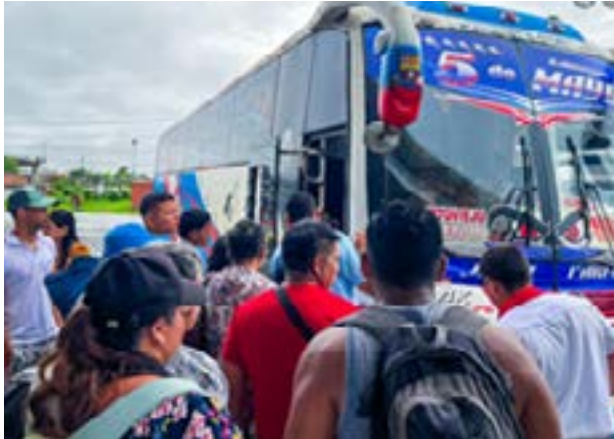
Pasajeros abordando los buses desde la nueva parada.