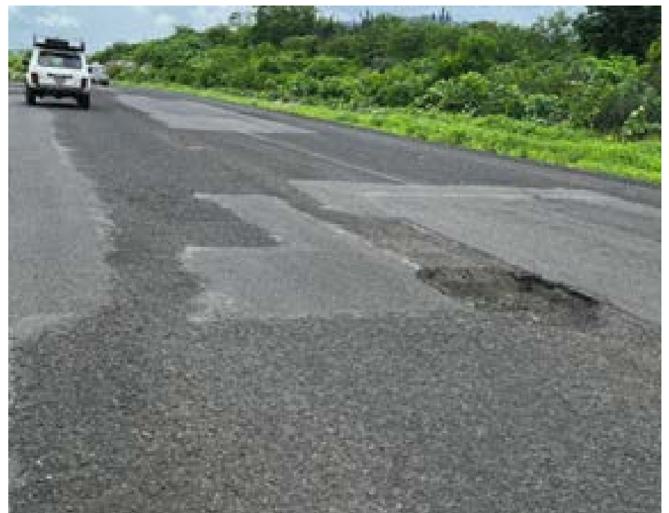
La situación afecta no solo en la seguridad vial, sino también el desarrollo de las localidades cercanas.